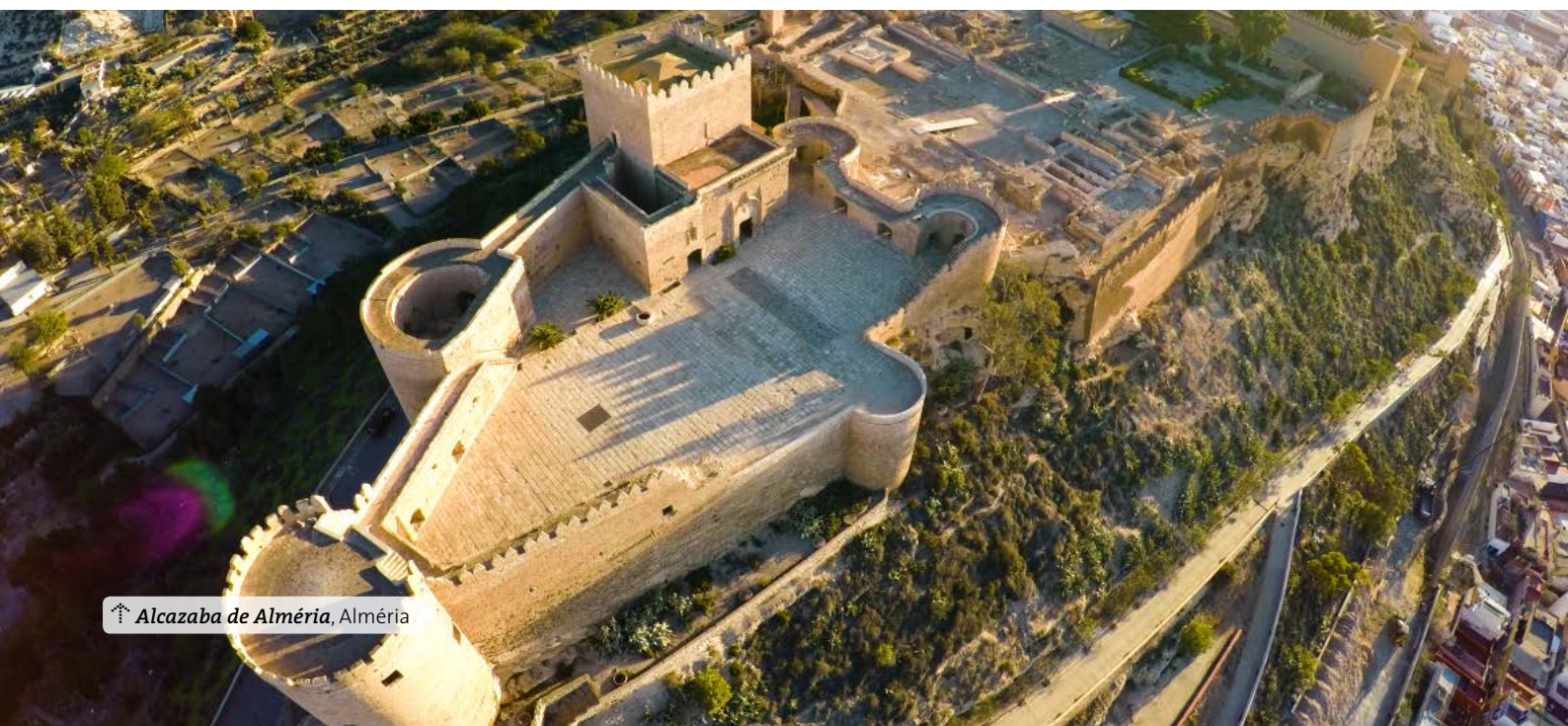
↑ Alcazaba de Almería , Almería