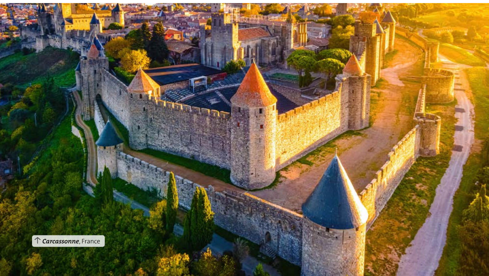
↑ Carcassonne , France