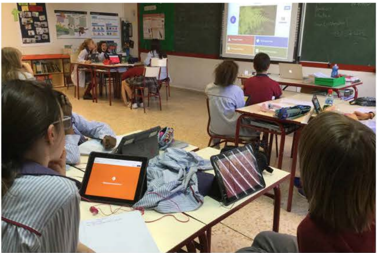
Alumnos durante una clase en el Colegio Británico de Aragón.