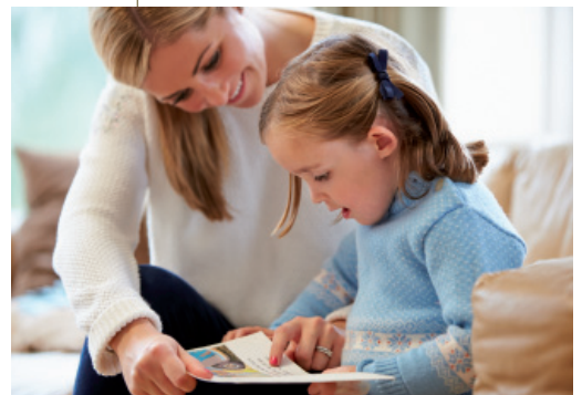
2.1. Cuanto más rico es el entorno lingüístico del niño, más favorece el desarrollo del lenguaje.

Son los libros, generalmente presentados en series y con abundantes ilustraciones, que suelen tener como protagonista un personaje común que pasa por diferentes situaciones del entorno cotidiano. Por ejemplo, los libros de Teo.