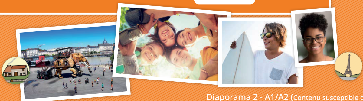
Diaporama 2 - A1/A2 (Contenu susceptible d'être modifié)